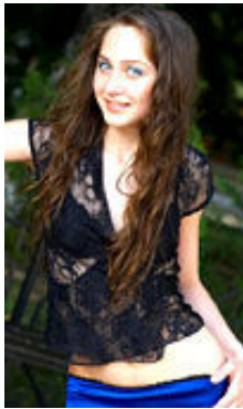
Vita 20 Jahre