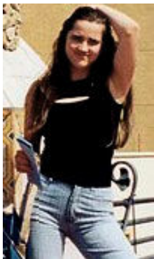
Victoria 30 Jahre