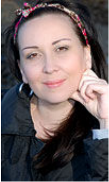
Iness 32 Jahre