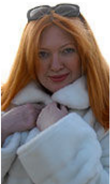
Alla 34 Jahre