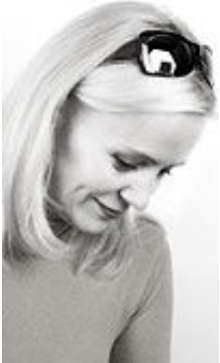
Valera 43 Jahre